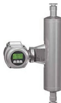
Figura 2: A Coriolis instalado em a bypass linha de desvio, tais como o Promass 831 da Endress+Hauser, mede a viscosidade da massa enquanto ela está sendo misturada.