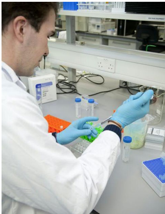
Figura 1: A coleta/recolha de amostras do processo para análise no laboratório da fábrica é o método testado e comprovado para garantir o controle de qualidade , mas é caro e não é uma medição em tempo real.

Os gerentes de fábricas de alimentos e bebidas de hoje enfrentam muitos desafios, entre os quais o de garantir a segurança dos alimentos e a qualidade dos produtos. Dependendo do produto que está sendo fabricado, os fabricantes podem ter que atender aos requisitos da Food & Drug Administration (FDA), European Union (EU) e uma sopa de letrinhas de outras agências e regulamentações. Essas normas especificam ingredientes adequados, riscos químicos e biológicos, procedimentos e condições sanitárias. Os gerentes de fábrica também têm que atender às expectativas dos consumidores quanto ao sabor e à textura adequados.