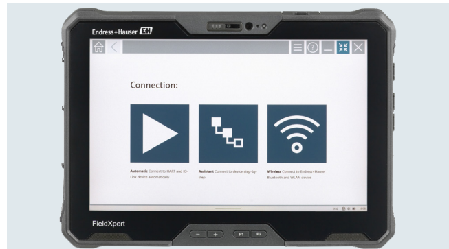
Field Xpert SMT50B