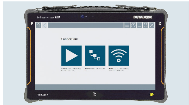
Field Xpert SMT70B