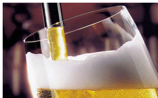
Bei der Bierherstellung ist eine strenge Kontrolle des Abwassers unerlässlich

Heute werden die Umweltvorschriften immer strenger, um eine Verschmutzung der Umwelt zu verhindern. Es können hohe Geldstrafen verhängt werden, wenn die Entsorgung mit organischer Belastung über dem von den Aufsichtsbehörden tolerierten Niveau liegt. Dies gilt auch für die Heineken-Brauerei in Brasilien. Mit der Lösung von Endress+Hauser ist sie in der Lage, ihr Abwassersystem jederzeit zu überprüfen und die ordnungsgemäße Funktion sicherzustellen.