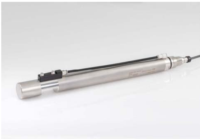
Digital nitrate or SAC sensor Viomax CAS51D

Der Industriemesstechniker fasst zusammen: "Es hat die Routine erleichtert. Heute wird die Kalibrierung im Durchschnitt alle zwei Jahre und ohne Verbrauchsmaterial durchgeführt, während das alte Gerät (Verbrennungsmessung) eine ständige Wartung mit Reinigung des Schlauchsystems und der peristaltischen Pumpen mit 15%iger Salpetersäurelösung erforderte. Wir sind jetzt in der Lage, diesen schwierigen Prozess zu vermeiden."