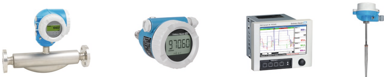
Eingesetzte Messtechnik: Proline Promass F 300, Cerabar PMP51B, Memograph M RSG45 und Widerstandsthermometer TR15 (von links nach rechts)

Endress+Hauser bietet hier ein Komplettpaket zur Effizienzermittlung der Kälteanlage: In der gasförmigen Phase zwischen Verdampfer und Kompressor wird der Massedurchfluss mit Proline Promass F 300 gemessen. Das Coriolis-Durchflussmessgerät überzeugt auch bei anspruchsvollen Medien und höheren Drücken mit sehr hoher Genauigkeit. Darüber hinaus erfolgt an zwei Stellen die Messung des Absolutdrucks mit Cerabar PMP51B: direkt vor Promass F sowie hochdruckseitig hinter dem Verdichter. In der Flüssigphase zwischen Kondensator und Verdampfer wird außerdem die Temperatur mit dem Widerstandsthermometer TR15 ermittelt. Der Energie- und Datenmanager Memograph M RSG45 berechnet aus den Messwerten die Kälteleistung und überträgt diese über das Kommunikationsprotokoll Modbus TCP an das Leitsystem der Energiezentrale. Dafür werden das von Endress+Hauser mitgelieferte mathematische Datenpaket und die darin hinterlegten Formeln durch Memograph M RSG45 genutzt.