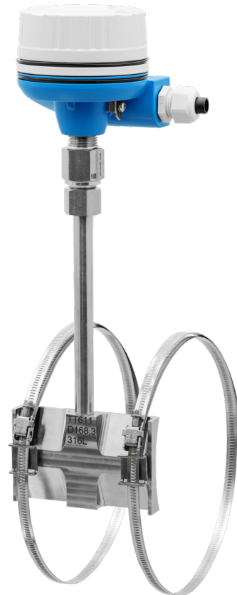
iTHERM SurfaceLine TM611

Fazit Das nicht-invasive Thermometer iTHERM SurfaceLine TM611 löst erfolgreich die Herausforderungen der Temperaturüberwachung in einem Wärmetauscher. Durch die genaue und schnelle Temperaturmessung können die Leistung und Effizienz des Wärmetauschers optimiert werden, was zu einer verbesserten Produktqualität und Betriebssicherheit führt.