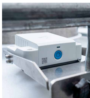
Micropilot FWR30 instalado en un contenedor IBC