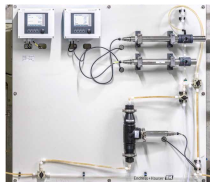
Memosens Wave CAS 80E (en haut à droite) dans le champ test dans une usine d'eaux usées

Le spectromètre fonctionne avec la nouvelle génération de transmetteurs Liquiline CM44 et peut être combiné avec tous les autres Capteurs Memosens. Cela offre l'avantage que le transmetteur Liquiline Memosens peut évoluer sans effort et vous garantir une flexibilité totale pour les années à venir. Avec notre vaste gamme de produits, Endress+Hauser vous propose tout ce dont vous avez besoin pour répondre aux exigences de votre eau et les applications de traitement des eaux usées.