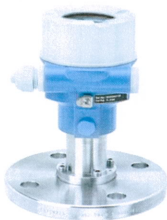
Cerabar M PMC51