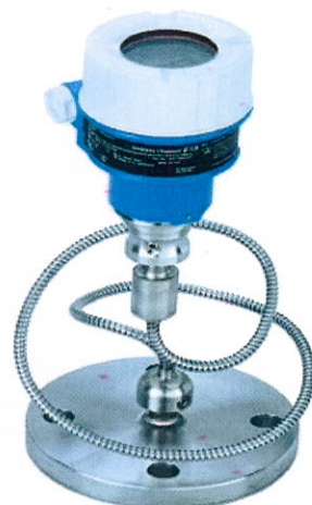
Cerabar M PMP55