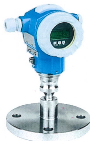
Cerabar S PMP75