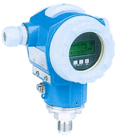
Cerabar S PMC71