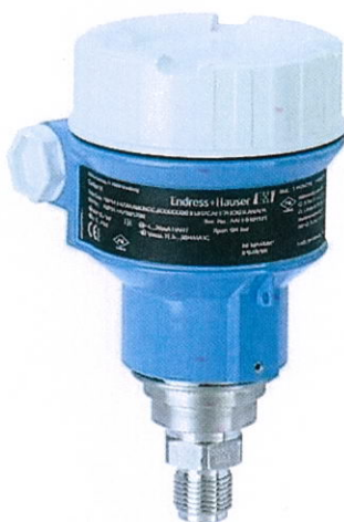
Cerabar M PMP51