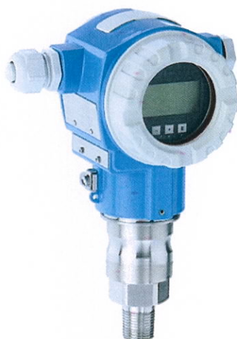
Cerabar S PMP71