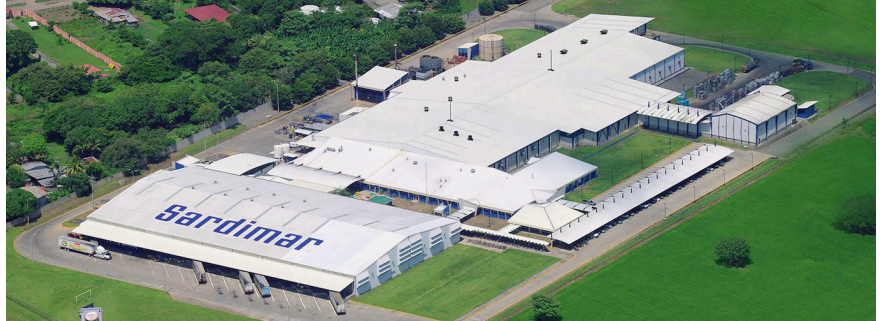
Alimentos ProSalud S.A., Puntarenas, Costa Rica.

Alimentos ProSalud S.A. es una planta procesadora de atún ubicada en Puntarenas, Costa Rica. Su prioridad es centrarse en procesos controlados de alta calidad. La certificación ISO 50001 ha sido un paso importante para mejorar el rendimiento y los indicadores en la caldera.