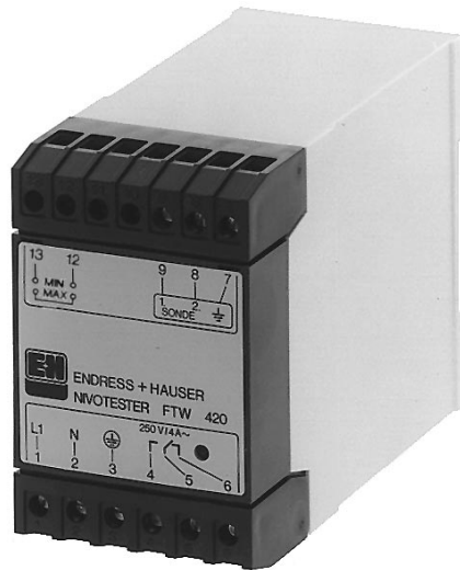
Nivotester FTW 420 im Minipac-Anreih- gehäuse für die Snap-in-Montage auf 35-mm-Normschiene.